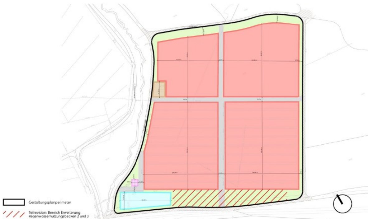
Plan Gestaltungsplanperimeter «Erbist» mit Änderungen

Der Gestaltungsplanperimeter «Erbist» (nachfolgend Perimeter genannt) umfasst die Parzelle Kat.-Nr. 1552 und befindet sich am Siedlungsrand von Otelfingen an der südöstlichen Grenze zu Boppelsen und Buchs ZH. Südlich schliesst der Perimeter unmittelbar an das Industriegebiet an und umfasst eine Fläche von 51'656 m 2 .