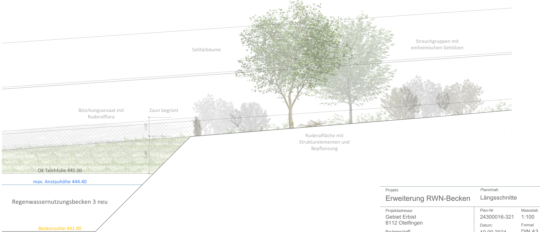
Längsschnittansicht A-A' 1:100 Ausschnitt RWN-Becken 3 / angrenzende Ruderalfläche